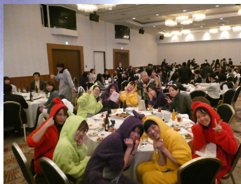
函館中央病院大忘年会にて