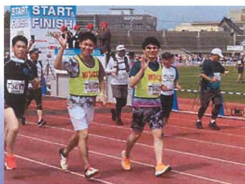
函館マラソンにて