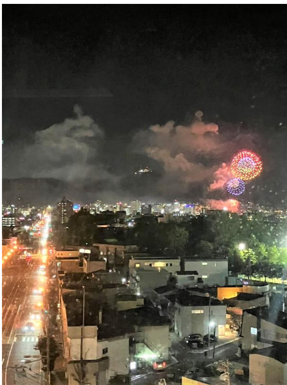
函館港まつり花火大会 ～当院総合医局(南棟8F)より～