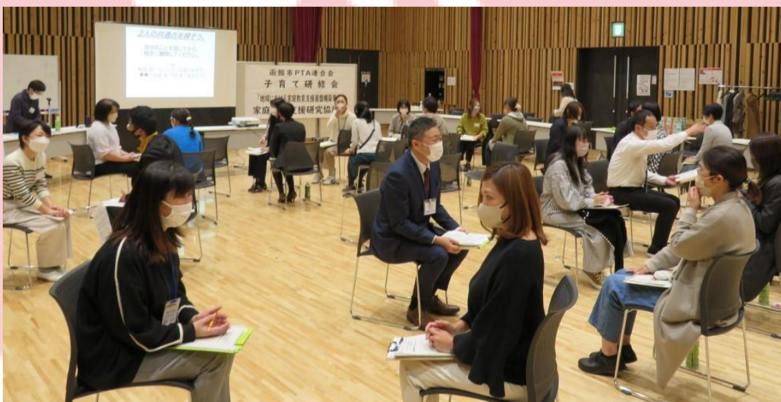
図2.子育て研修会の模様

また、函館市PTA連合会は市内の色々な委員会に所属しています。中には「いじめ」「居場所」「支援」について議論する場があり、こども子育て支援室を有する当院のスタッフ、そして函館市PTA連合会会長としての2つの顔を活かし、当院の理念「こどもと共に、子育てを共に、地域と共に」を掲げ活動していきます。