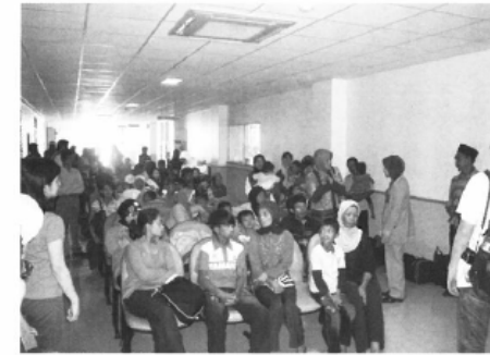
治療を待つ子どもたち

函館中央病院・歯科口腔外科（函館市）は、日越国交樹立四十周年記念事業の一環として行われた医学歯学交流ワークショップで、ベトナムのハノイ医科大学学長から医療援助活動に関する感謝状を授与された。同事業はベトナムのグエン・タン・ズン首相が来日した際に、当時の野田佳彦首相と平和と繁栄のための共同声明を発表し、その友好記念事業の一つとして実施されたもの。こうした海外への支援活動は、辻科長が札幌医科大学医学部口腔外科講座に在籍した際に、NPO法人日本唇口蓋裂協会によるボランティア活動に参画したことに端を発するとい