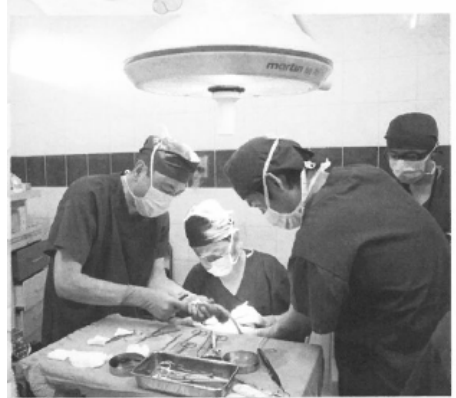
唇口蓋裂の手術のもよう

す。スラウエシ島でも唇口蓋裂の手術が行える歯科医師は二人だけ。私たちは無料の手術と歯科医師への指導という一本立てという形で活動を行っています」。唇口蓋裂は善美面での治療も大切だが、会話を摂食時の機能回復が最も重要となる。一年に一度しかも滞在時間も限られる中では、一人の歯医者さんにかける時間は決して十分とはいえない。関わるほどに絶えない課題を抱えているのが現状だが、「それでもまったく治療の手が差し伸べられることのなかった病气。子どもたちに微笑みを取り戻してあげるためにも継続していきたい」と話す。